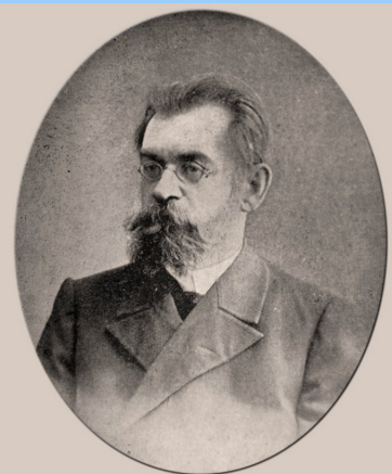
Василий Иванович Разумовский первый ректор Саратовского университета

Для строительства теоретических корпусов ему удалось получить территорию в центре Саратова, а в дачной местности — участок земли для клинического городка. В. И. Разумовский писал: «После торжественного открытия университета приступили к строительству новых университетских зданий. Началась долгая, многострадальная строительная эпопея. После долгих лет относительно спокойной научной и академической жизни я окунулся в эту житейскую грязь и только благодарил судьбу, что я обеспечен честным архитектором и хорошим техническим надзором. Из хирургической практики я знаю, как часты у нас эти несчастья при постройках с увечьями, жертвами и т. д. У нас за все время строительства (несколько лет, при нескольких стах рабочих) таких несчастий не было, если не считать лёгких ушибов... Саратовский университет построен не на костях, и для нас не звучит укором стихотворение Некрасова про железные дороги и кости рабочих. На 3-й год, в разгар строительного периода, в городе развилась сильная холера. Благодаря принятым мерам (кипяtilьники, выдача денег на баню всем рабочим по субботам и пр.) мы не имели ни одного холерного заболевания среди рабочих, которых в это время у нас было больше 300 человек. И теперь, спустя долгие годы, эти факты мне доставляют высокое моральное удовлетворение!»